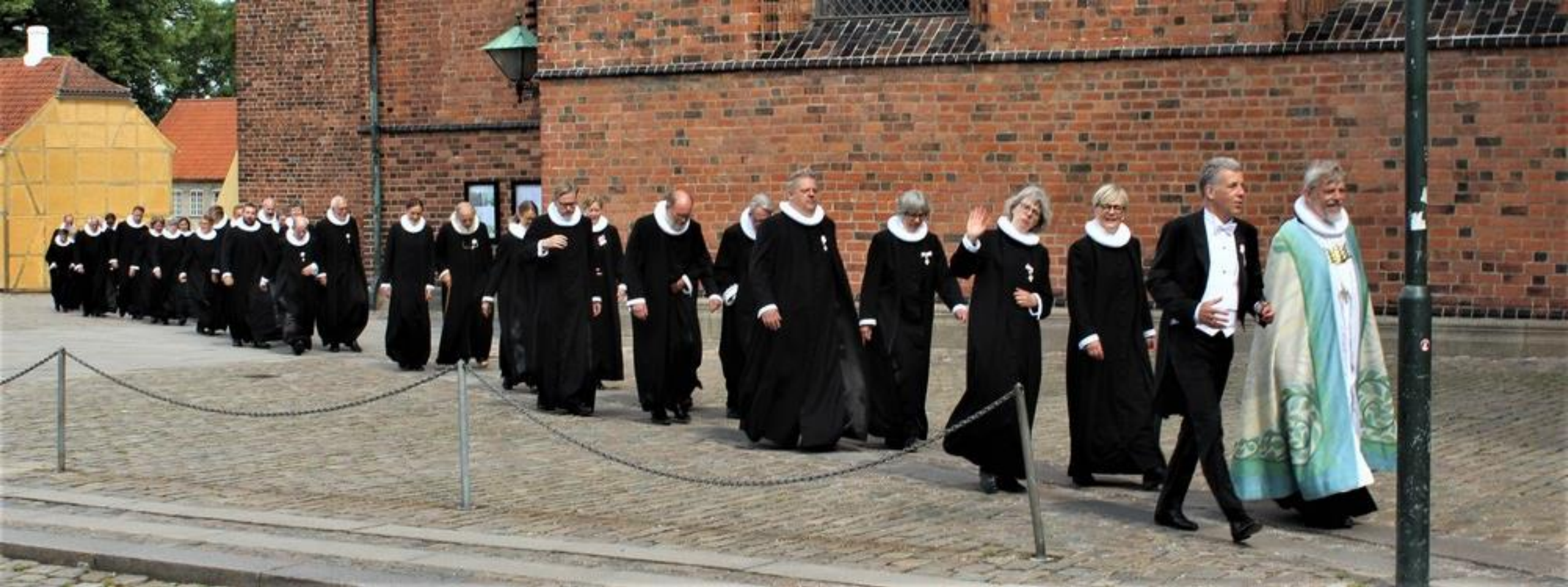
Biskop med provster og præster. Roskilde